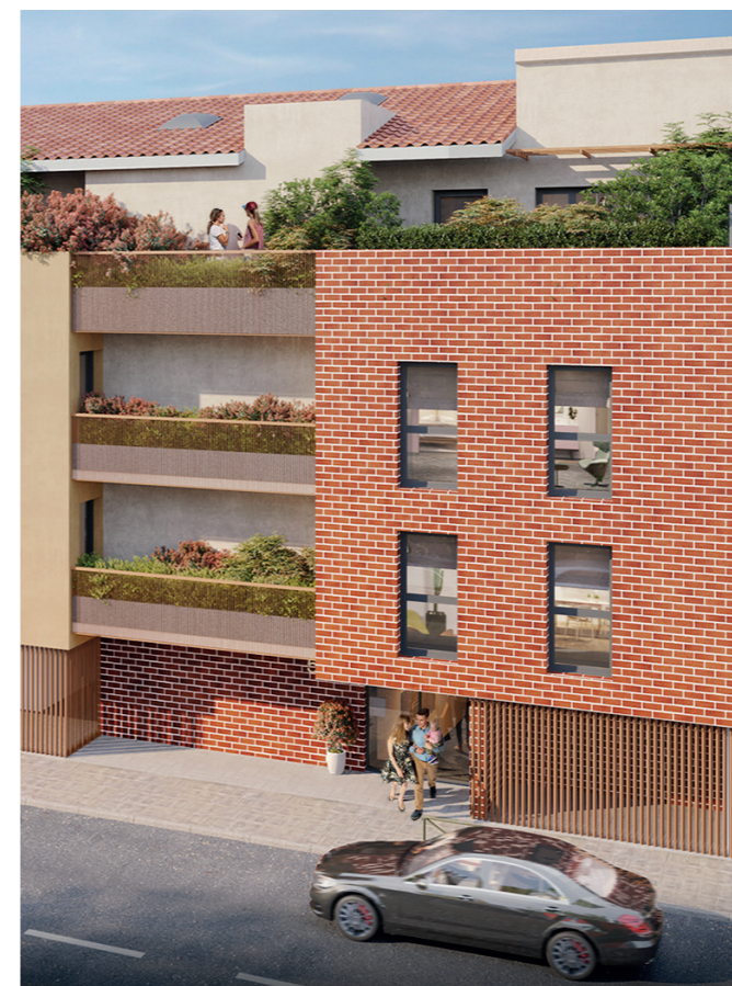
530, AVENUE DU LAURAGAIS - LABARTHE SUR LÈZE

Implantée au cœur du centre de la ville de Labarthe-sur-Lèze, la résidence ALMA bénéficie d'un emplacement exceptionnel, donnant un accès immédiat aux commerces, commodités et infrastructures culturelles et sportives - notamment pour les couples et les familles. La médiathèque Françoise Giroud, le centre L'Astrolab proposant cinéma et salle de spectacles, sont situés quasiment en face de la résidence, de l'autre côté de la rue. L'école maternelle et primaire Saint-Louis ainsi que le Groupe Scolaire des Trois Moulins sont à 3 minutes à pied et l'aire de jeux du Petit Bois dans lequel les enfants pourront jouer après l'école, se situe juste à côté. La ligne de bus Tisséo 316 dont l'arrêt sera situé à quelques minutes également, mène directement à la Gare SNCF de Muret.