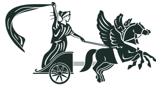
Déesse Aurore, mère des étoiles & des vents