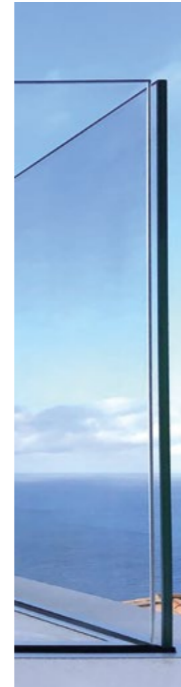
Garde-corps en verre pincé