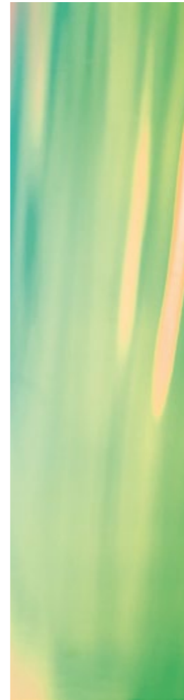
Panneaux de verre dichroïque**