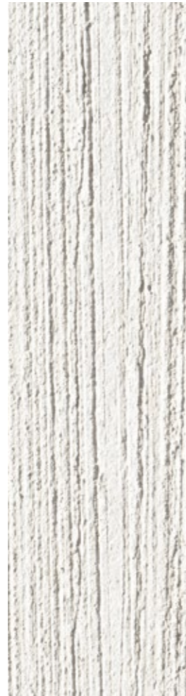
Socle en béton matricé

C'est drapée de son manteau étoilé que l'audacieuse défie les astres mais c'est par ses lignes simples et épurées qu'elle impose son élégance au cœur de la ZAC.