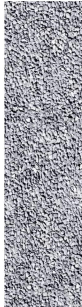
Perméabilité des espaces extérieurs