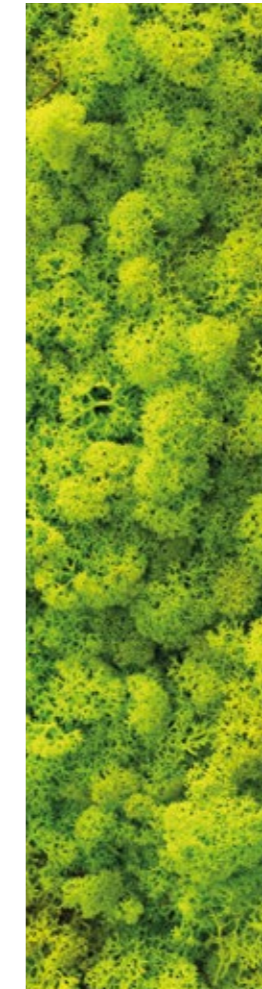
Végétalisation des rooftops