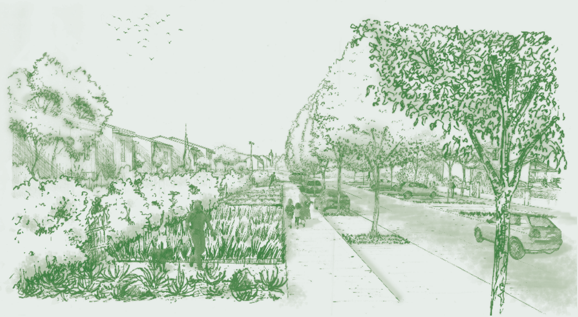
Les jardins volcaniques