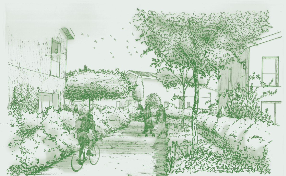
La Venelle piétonne centrale, espace apaisé, tempéré et agrémenté par les plantations permet de relier le quartier au centre historique

Besdan etc et Claude Agence Robin & Carboneau 2021