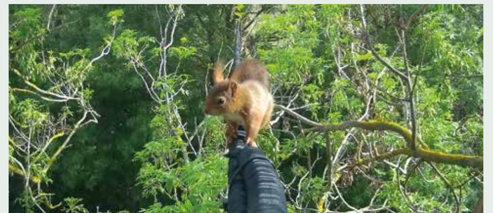
Écureuil sur l'écuroduc, route d'Agde à Bessan.

Association Cohabitation Sauvage pour une Nouvelle Alliance Homme Animal