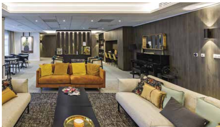
LES BALCONS DE MONTCALM - Montpellier